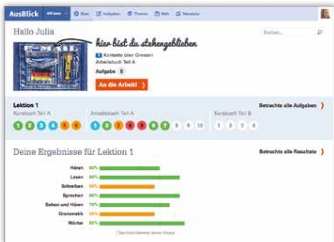
ICT startpagina voor de leerling

U heeft de keuze uit een arrangement dat uit boeken bestaat, volledig digitaal is of een combinatie van beide.