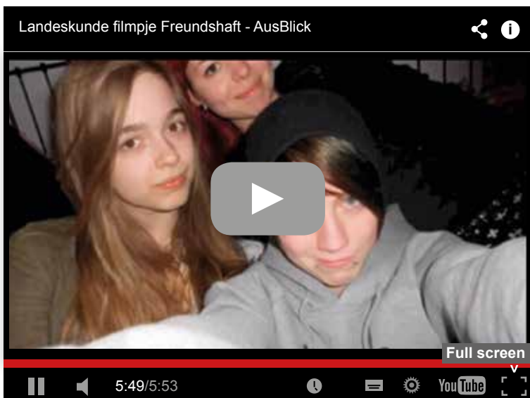
Oefenmateriaal voor het Goethe-Zertifikat

Met een uitgebreide spraaktraining, extra (online) oefenmateriaal en oefenexamens bereidt AusBlick uw leerlingen optimaal voor op het Goethe-examen en heeft u geen aparte klassen meer nodig. Met het internationaal erkende Goethe-Zertifikat biedt u uw leerlingen een uitstekende startkwalificatie voor de toenemende handelsmarkt met Duitsland en de internationale arbeidsmarkt in het algemeen.