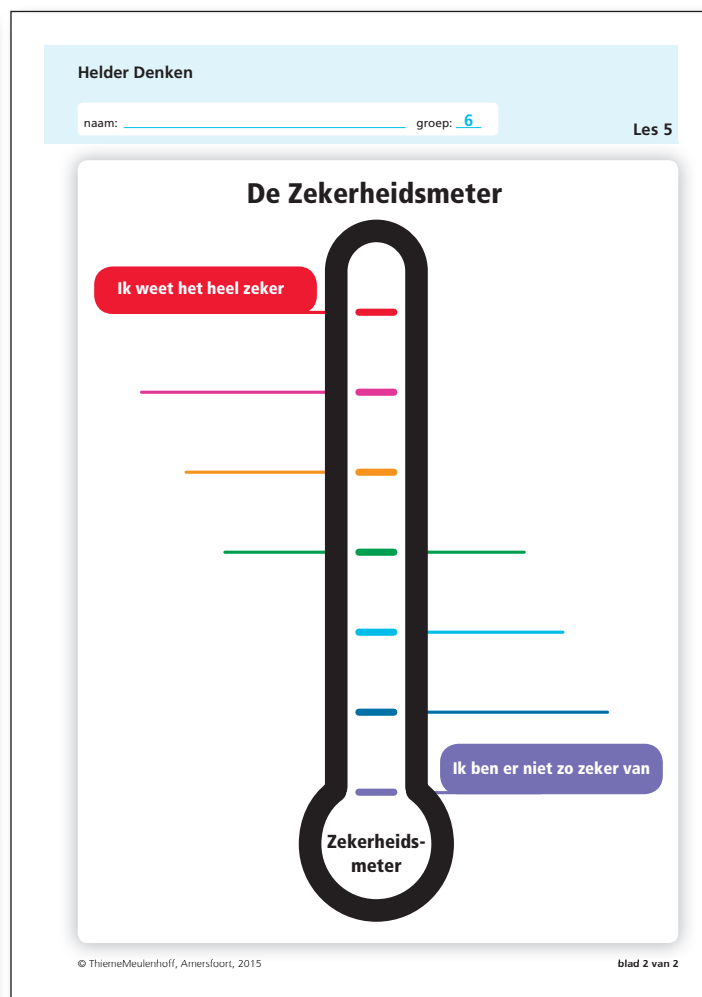
Helder denken blad 2